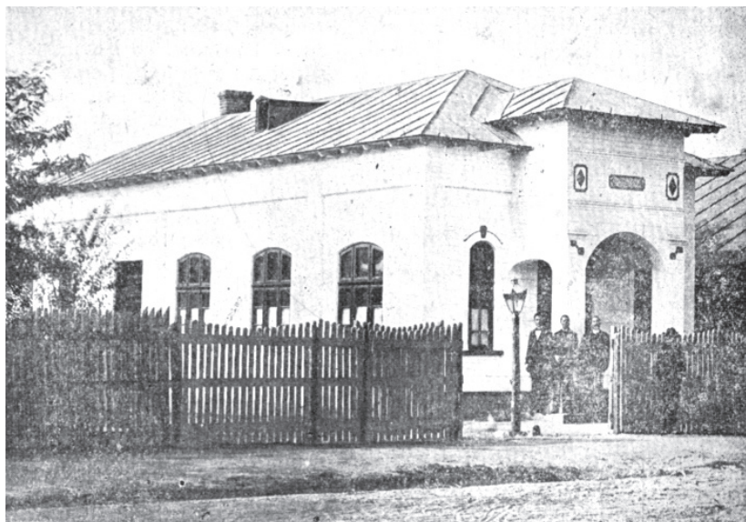
Capela adventiștilor de ziua a șaptea din Alexandria, str. Cuza-Vodă, nr. 55